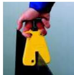
Abertura e Fecho