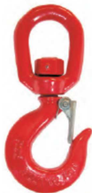
Aço Carbono C40