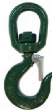
Aço Alloy (Corpo) Aço C40 ( Destorcedor)